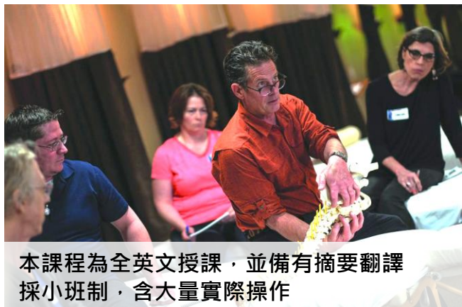
本課程為全英文授課，並備有摘要翻譯 採小班制，含大量實際操作

2020 年 Advanced-Trainings 高級肌筋膜技術發起人暨首席講師-Til Luchau 首度來台，在疫情起始之初，為來自世界各國的學員們，帶來一場肌筋膜知識的饗宴。2023 年，我們再次邀請 Til Luchau 來台授課，本課程強調小班制教學與實務練習，由講師及助教群親自帶領學員熟悉坐骨神經與椎間盤相關的進階肌筋膜放鬆技巧，將多年徒手經驗與學員們分享，確保每一位學員皆能完整學習到講師要帶給大家的肌筋膜思維與應用，在後疫情時代，國際交流再度啟動的此刻，邀請大家共同加入這場坐骨神經與椎間盤的學習之旅。